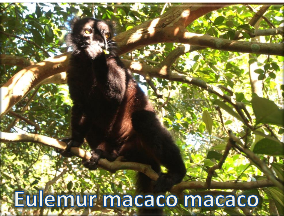
Eulemur macaco macaco