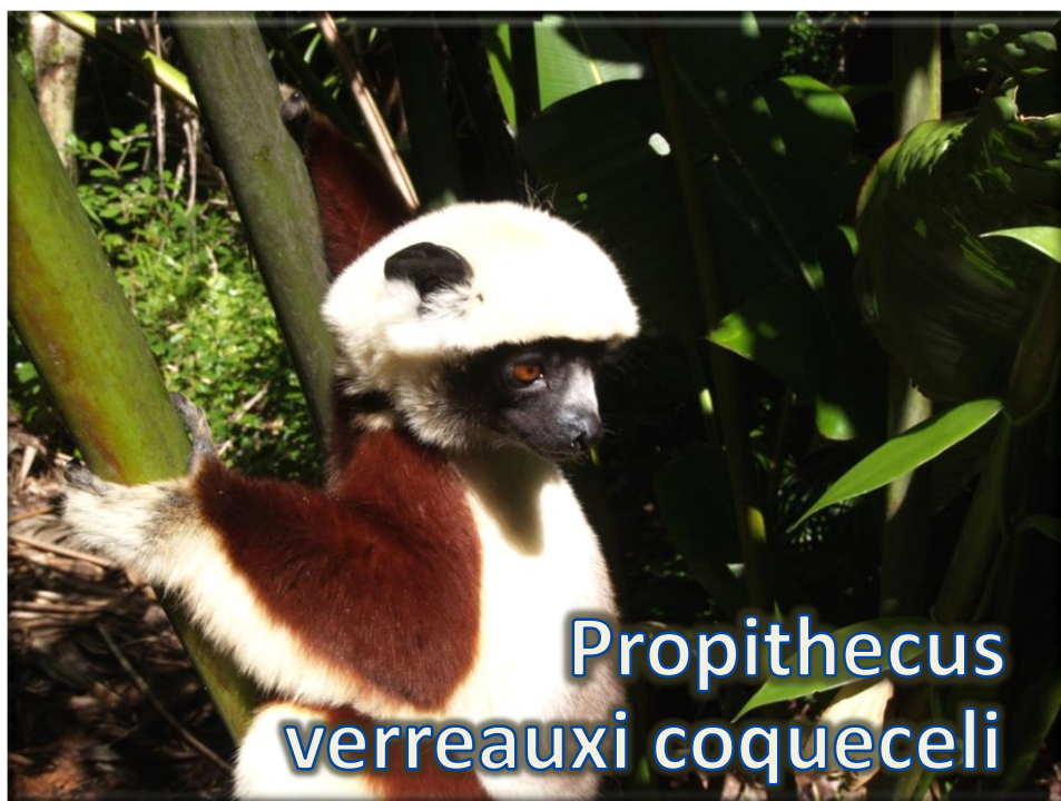
Propithecus verreauxi coqueceli