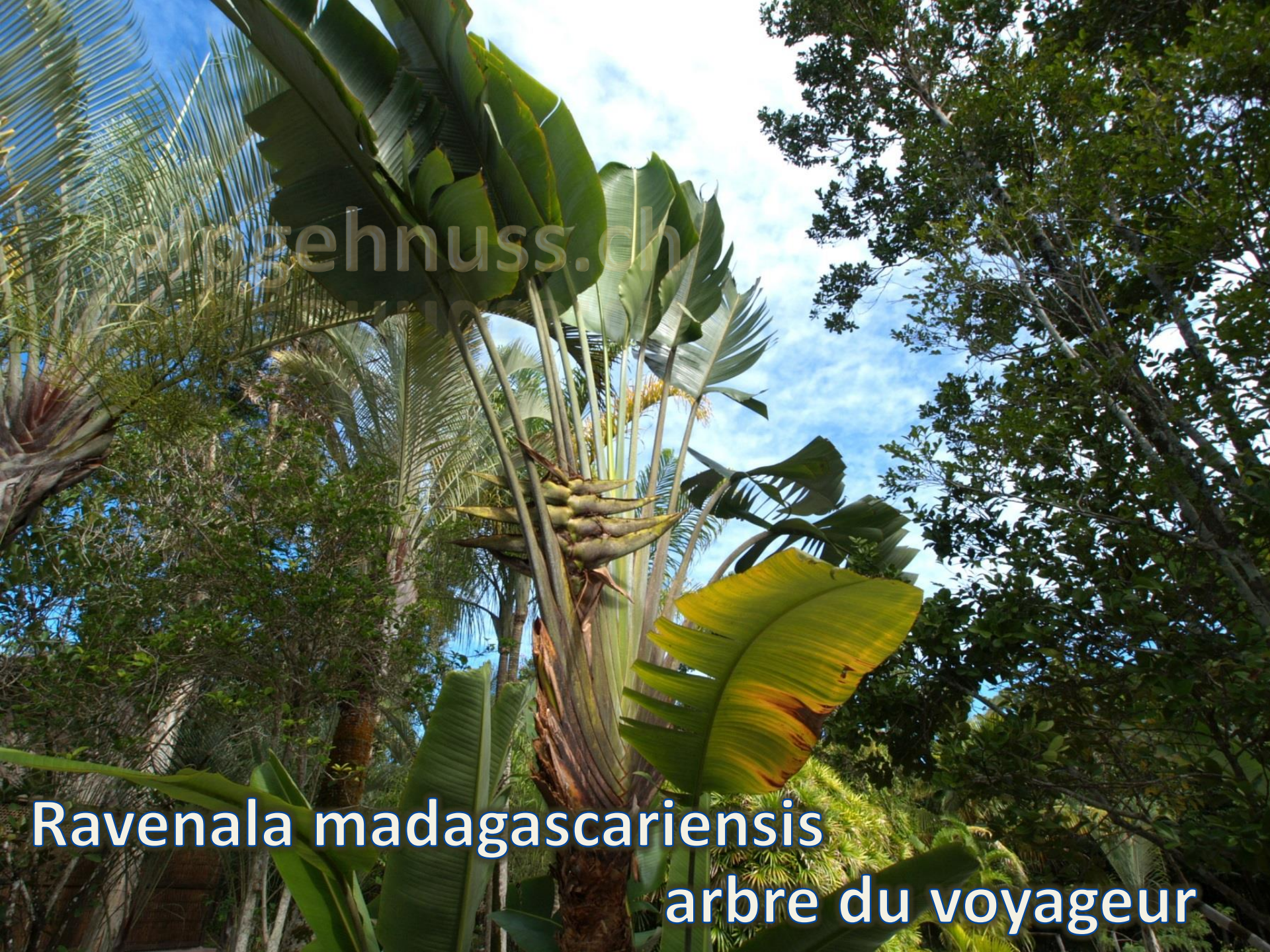
Ravenala madagascariensis arbre du voyageur