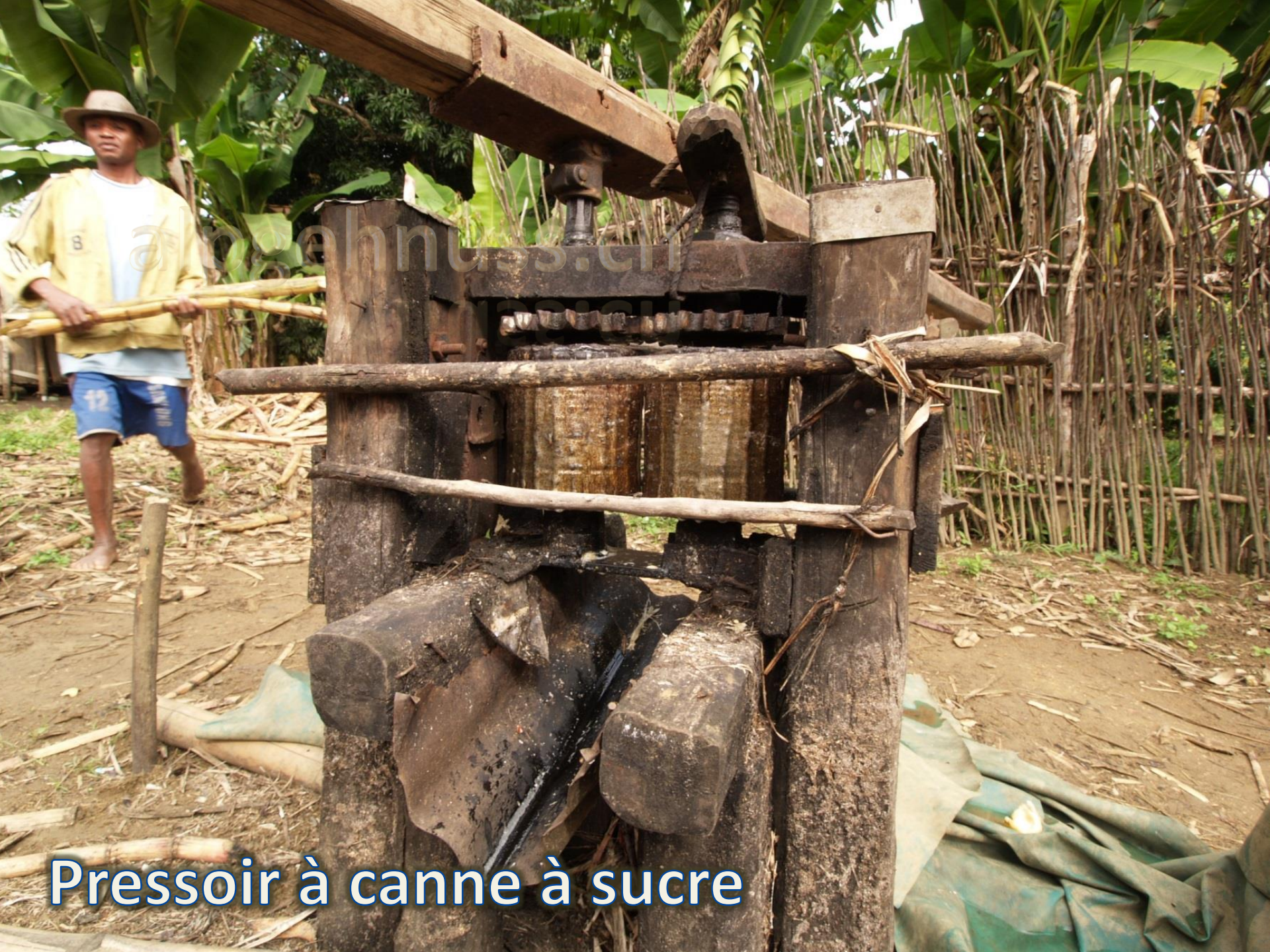
Pressoir à canne à sucre